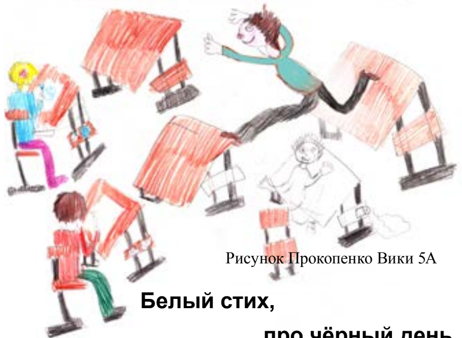
Рисунок Прокопенко Вики 5А