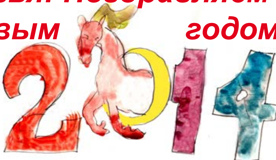
Рисунок Поцук Машы 3«в»