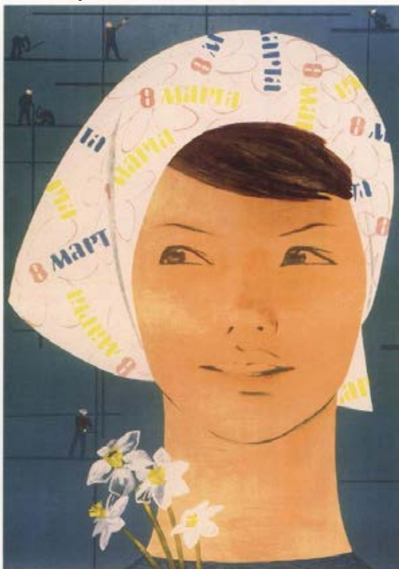
С ПРАЗДНИКОМ ВАС, ДЕВУШКИ!

В школах России 8 марта, день, когда всем девочкам мальчики дарят подарки. Этот день означает приход весны на территорию школы, которая одновременно является частью страны. А также, близость окончания 3 четверти и скорый приход весенних каникул. Праздники в нашей жизни любят все, и дети не являются исключением.